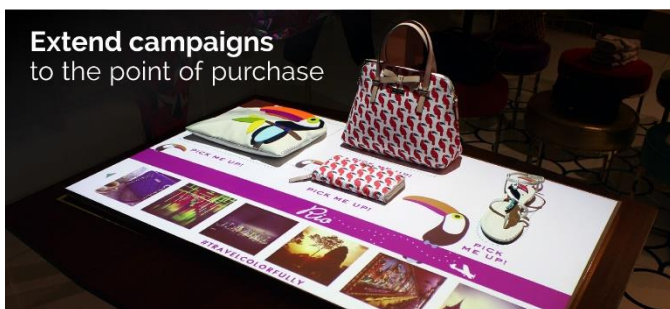
Extend campaigns to the point of purchase