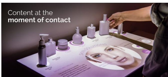
Content at the moment of contact

Des Rätsels Lösung ist eine Videoprojektion, die sich interaktiv steuern lässt. Die Bewegungen des Kunden werden über eine Kamera erfasst, der projizierte Content entsprechend geändert.