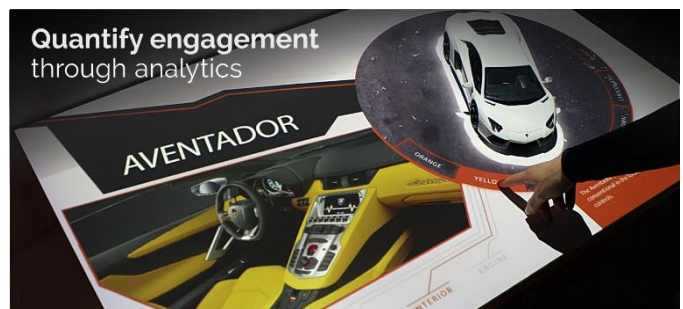
Quantify engagement through analytics

Des Rätsels Lösung ist eine Videoprojektion, die sich interaktiv steuern lässt. Die Bewegungen des Kunden werden über eine Kamera erfasst, der projizierte Content entsprechend geändert.